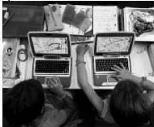
Parte da Roma una campagna per diffondere sistemi per insegnare ad avvicinarsi a Internet senza correre rischi

ROMA. Adulti «immigrati digitali» che nel web faticano ad alfabetizzarsi. Sono i genitori e i docenti dei bambini che navigano nelle tecnologie da veri «nativi digitali». Un "gap" che depotenzia l'educazione all'uso del web: a scuola si insegna la videoscrittura, il disegno e la ricerca sui siti culturali, ma i ragazzi imparano da soli - a loro rischio e pericolo - a navigare, chattare, giocare, scaricare, comunicare sui social network come Facebook. È quanto emerge dalla campagna di diffusione dell'informazione sui sistemi di tutela della navigazione dei minori, condotta dall'associazione Centro Elis, col sostegno dalla Feo-Fivol, su 50 scuole primarie di Roma che ha coinvolto mille genitori: distribuendo 2 mila guide per navigare senza pericoli e 2 mila